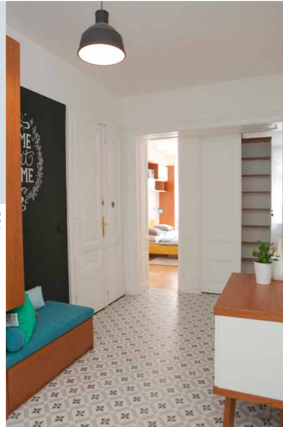
Keramická dlažba s výrazným vzorom je výrazným retro štýlovým prvkom interiéru.

Za vstupný priestor by sa nemuseli hanbiť oveľa väčšie bytové jednotky.